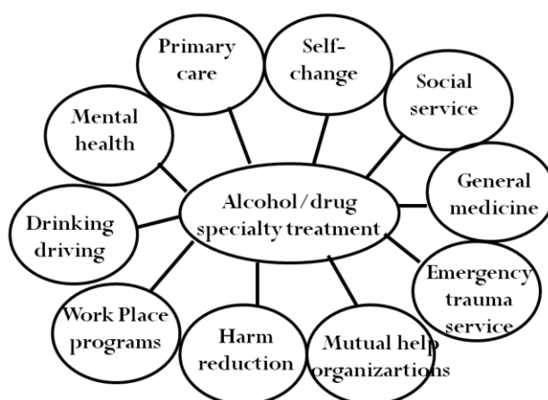
Figure 1. The total alcohol/drug intervention system (Babor et al 2008)

Behandlingssystem-effekt: Måske grundet den forholdsvis ringe udvikling af efterbehandlingseffekten gennem de senere årtier er der i dag blevet lidt større fokus på at undersøge betalingssystemer i deres helhed, forstået som alle de systemer der bidrager til at personer kommer ud af sit stofmisbrug (se figur 1 og litteraturhenvisning 107)